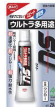
シリル化ウレタン 樹脂系接着剤

取付けの際の接着剤はコニシ株式会社製のボンドウルトラ多用途SU(エス・ユー)色調クリアーをおすすめします。 小売店でお買い求め下さい。